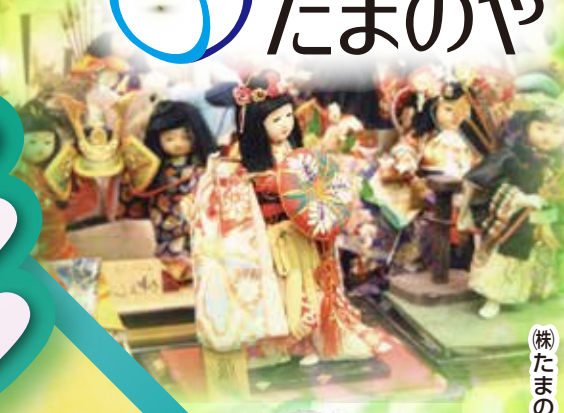
（株）たまのやイメージキャラクター