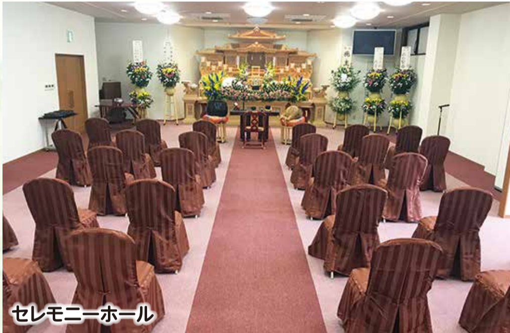
セレモニーホール

席の間隔を空け、ご会葬者同士の距離を十分に確保いたします。 【通常時 150名→感染症対策 47名】(写真はイメージ)